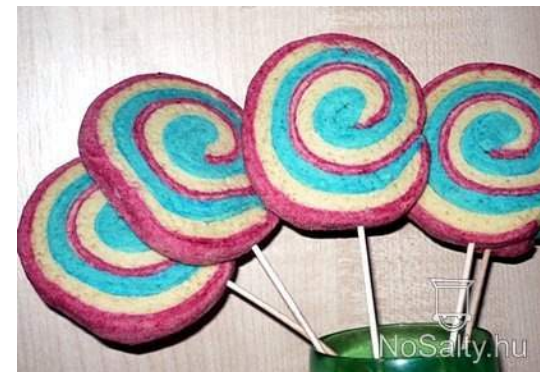
Dévényi Csenge (6.a)

A megfejtéseket küldjétek el Ákos bácsinak finom nyeremények reményében október 18-ig!